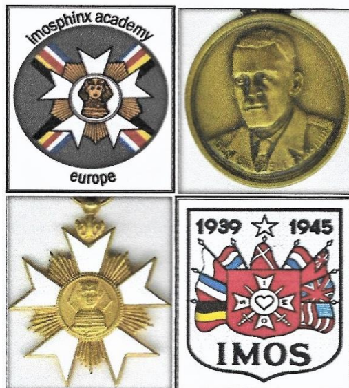
Zajęcie: Symbole IMOSPHINX