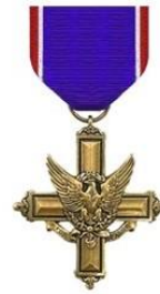
Distinguished Service Cross