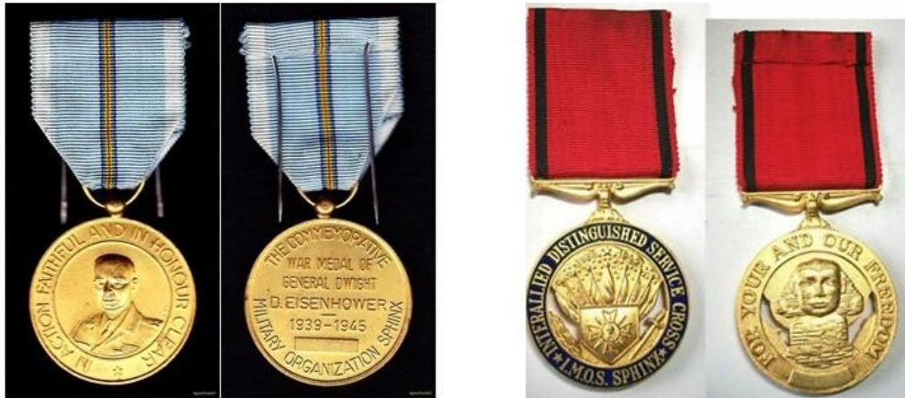
Zdjęcie: Medale Eisenhower'a nadawane przez IMOSPHINX

Organisation Sphinx - IMOSPHINX ). Generał Eisenhower wyraził także zgodę na wyjątkowe prawo do przyznania dwóch odznaczeń z jego nazwiskiem: "Medal Wojenny generała Eisenhamera" i "Krzyż za Wybitną Służbę". Wyróżnienia te miały na celu nagrodzenie weteranów, więźniów politycznych, agentów wywiadu, bojowników ruchu oporu i deportowanych, w tym szczególnie tych, którzy byli częścią sieci ART - IMOSPHINX.