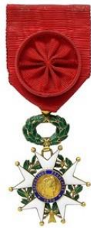
Legion d'Honneur IV